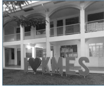
Larawan 14. Kapitan Moy Elementary School. Kuhang larawan ng may-akda noong Oktubre 13, 2020.

noon ang mismong tahanan ni Kapitan Moy pagkatapos itong idoneyt ng angkan sa pamahalaan noong Marso 11, 1912 (KMES, w.tn). Naging ganap na paaralang elementarya ang Kapitan Moy noong Hunyo 4, 1976 (KMES, w.tn). Sa pagdaan ng panahon, inilipat ang Paaralang Kapitan Moy sa pinaghahatiang espasyo nito sa Marikina Elementary School bago ang taóng 2000 (Basijan, 2020). Kinalauna’y inilipat muli ang Paaralang Kapitan Moy malapit sa/mismo sa Marikina Heights High School (na itinayo naman noong Mayo 30, 2000 at naging hiwalay na paaralan noong Marso 2, 2004) (MHHS, 2004). Sa ngayon, isa nang hiwalay na paaralan ang Kapitan Moy Elementary School [cf. Larawan 14]. Patunay ang paaralang ito sa naging kontribusyon at pagkilala kay Kapitan Moy ng mga Mariqueño.